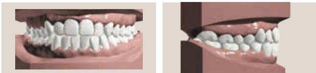
Occlusion en bout-à-bout