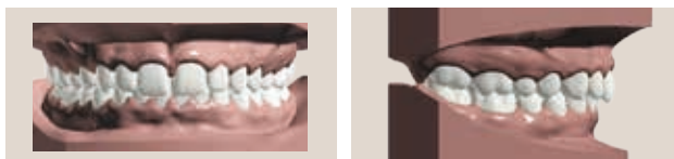
Supraclusie avec espaces au niveau des dents antérieures