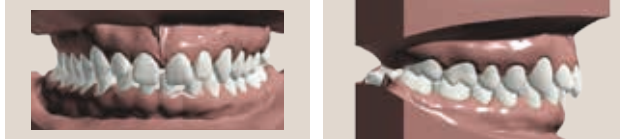
Dents très espacées