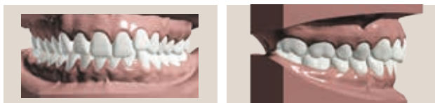
Encombrement avec occlusion croisée