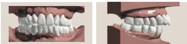
Occlusion croisée avec surplomb accru