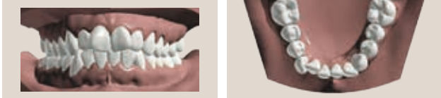
Encombrement dentaire grave /dents de travers