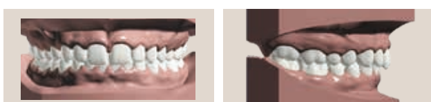
Morso profondo con spazi nell'area dei denti frontali