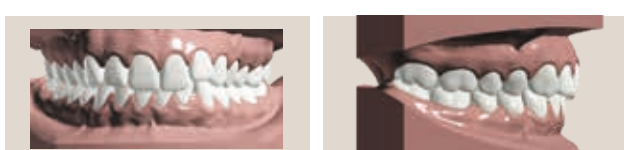
Affollamento con morso distale