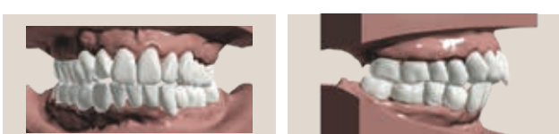
Morso distale con overjet eccessivo