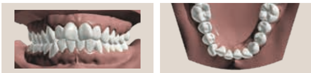
Affollamento e disallineamenti